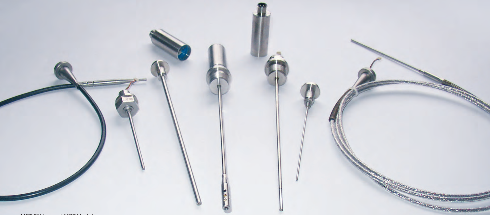
MST-Fühler und MST-Module